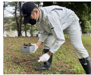
釜石市球技場 整備