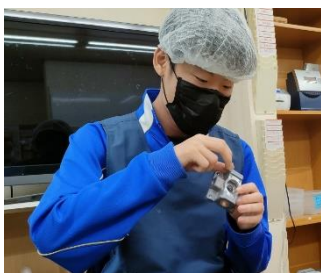
つくし共同作業所

2年生は前期とは別の福祉事業所や企業での実習となりました。新しい作業など緊張もあったようでしたが、全員欠勤なしでやりとげました。3年生は卒業後の進路先の決定につながる大事な実習となり、自分の適性や働くために必要な力を実感し自分と向きあった9日間となりました。今回の反省を学校生活で意識して自分の進路実現を目指しましょう。福祉関係事業所、企業、御家庭の皆様の御協力ありがとうございました。