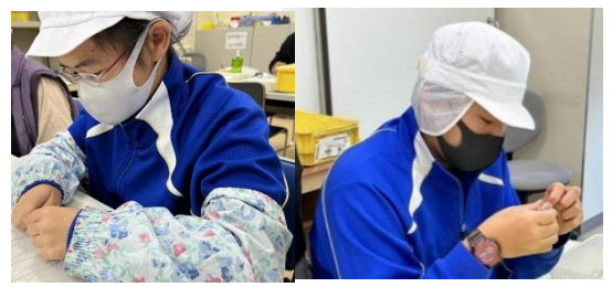
かまいしワーク・ステーション