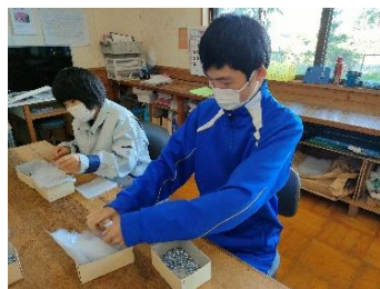
夢工房・カトレア