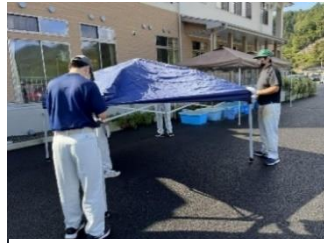
作業用テント張り