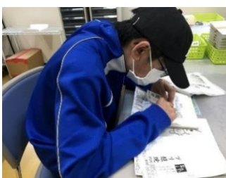
釜石市福祉作業所