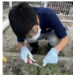
ラベンダーの剪定